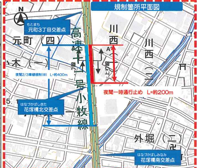
(国土地理院標準地図に地名、範囲を加工掲載)